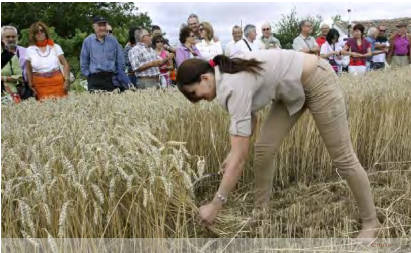
Una mujer siega trigo con la hoz.

Sevilla, 21 mar (EFE).- Andalucía producirá trigo duro de alta calidad para competir con países como Canadá, Estados Unidos o Francia gracias a un proyecto de investigación impulsado por Cooperativas Agroalimentarias de Andalucía, Agrovegetal y Pastas Gallo, según un comunicado de Cooperativas Agroalimentarias.